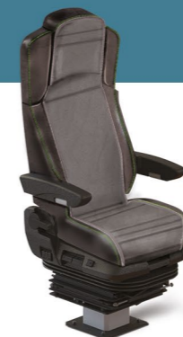
MKS KOMFORT EXT