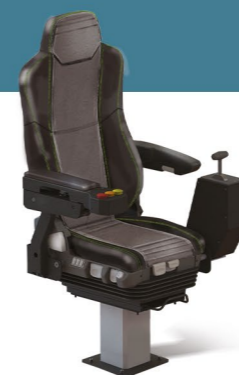
MKS RAIL KOMFORT