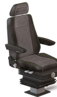
MKS RAIL STANDARD M