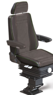
MKS RAIL STANDARD PAN