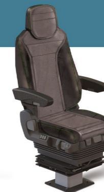
MKS RAIL KOMFORT II