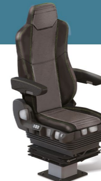
MKS RAIL KOMFORT I