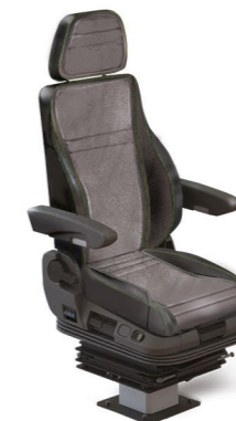
MKS RAIL KOMFORT SUP